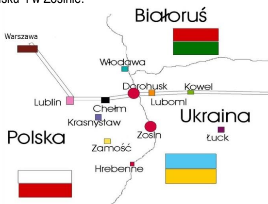
Rysunek 2. Przejścia graniczne w Dorohusku i w Zosinie.